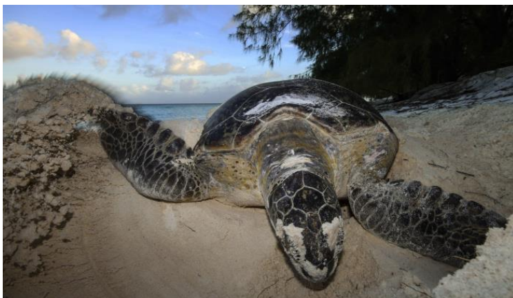
An early morning nesting green turtle on Settlement Beach on Aldabra Atoll

The Aldabra Atoll has the second largest green turtle population in the region, which is still growing, thanks to 50 years of enforced protection.