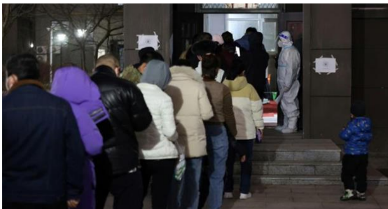
Des habitants d'un quartier résidentiel de Changchun, en Chine, font la queue pour se faire dépister le 11 mars 2022.

Nouvelles mesures, nouveaux bilans et faits marquants : un point sur les dernières évolutions de la pandémie de Covid-19 dans le monde.