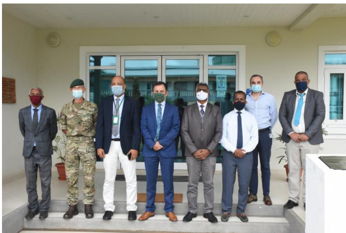
A souvenir photograph to mark the occasion

The Regional Coordination Operations Centre which facilitates joint or jointly coordinated interventions at sea recently benefited from a virtual capacity building event, courtesy of the British Royal Navy.