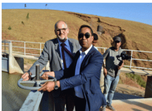
Lors de l'inauguration de la centrale hydro-électrique de Sarobaratra.

A peu près 300 millions d'ariary. Tel est le coût de la construction de la micro-centrale hydro-électrique fournissant une puissance de 100kw, installée dans le fokontany de Fialofa, commune rurale de Sarobaratra dans le district de Miarinarivo Itasy. C'est le fruit du partenariat entre le CEAS (Centre Ecologique Albert Schweitzer Suisse), l'association PATMAD (Partenariat Technique à Madagascar), l'Association des Ingénieurs pour le Développement des Energies Renouvelables avec l'appui de l'ADER (Agence de Développement de l'Electrification Rurale). Ce projet est réalisé par la société WeLight , la joint-venture entre le groupe Axian et Sagemcom, sur financement de l'Union européenne via le programme de développement des énergies renouvelables de la Commission de l'Océan Indien. Ainsi, 642 ménages dans la commune rurale de Sarobaratra ont maintenant accès à ces énergies renouvelables.