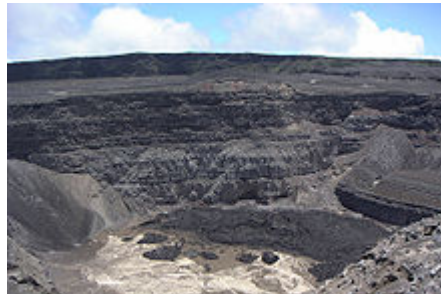
Cratère du Karthala