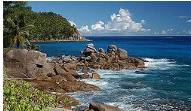
L'île de Mahé